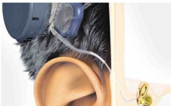
Imagen de un implante coclear en el exterior y el interior del oído. | MED-EL